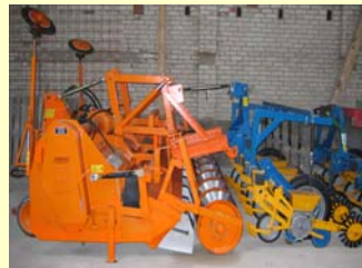
Abb. 2: Dammformgerät (Zinkenrotor, Dammformwalze) mit aufgesetzter Drillmaschine