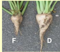
Abb. 1: Zwischenenerntergebnis von Rüben mit gleichem Saattermin, links Flachsaa (F), rechts Dammanbau (D)

In Praxisvergleichen von Flach- zu Dammanbau von Zuckerrüben auf verschiedenen Standorten in Norddeutschland wurden Mehrerträge von bis zu 15 % erzielt (Abb. 1). Ein höherer Ertrag der Zuckerrüben im Damm könnte durch eine schnellere Erwärmung des Saathorizonts im Damm und einer damit verbundenen beschleunigten Keimung, einem rascheren Feldaufgang und einer längeren Vegetationsperiode begründet sein. Die vergrößerte und günstiger gestaltete Bodenoberfläche im Damm könnte eine leichtere Durchwurzelbarkeit und eine intensivere Nährstoffversorgung ermöglichen und entscheidend zu einem Mehrertrag in der Jugendphase der Zuckerrübe bis zum Reihenschluss beitragen.