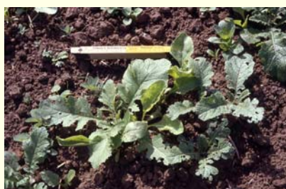
Abb. 3: Ausfallraps zwischen Zuckerrüben