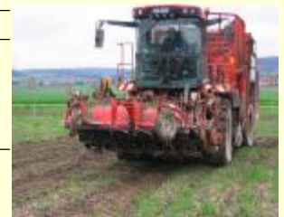
Abb. 1: Köpfrödebunker (6-reihig), Befahrung Spur an Spur, Reifeninnendruck 200-300 kPa, ca. 34 t Gesamtmasse (halb beladen, Rodeaggregat ausgehoben).