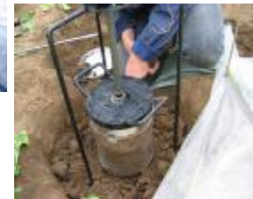
Abb. 1: Vorbereitung der Bodenprobenahme